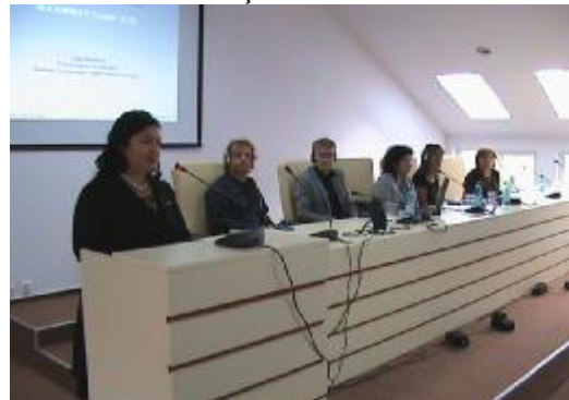
Figura nr. 2. Sala de conferințe

La sediul Spitalului de Psihiatrie Titan “Dr. Constantin Gorgos” din Bd. Nicolae Grigorescu nr 41, sector 3, București, a avut loc în data de 15.02.2010, ora 11:00 inaugurarea Centrului de Instruire și Intervenție în Sănătatea Mintală Comunitară. La eveniment au participat reprezentanți ai Ambasadei în România a Regatului Țărilor de Jos, ai Ministerului Sănătății din România, ai Centrului Național de Sănătate Mintală și Luptă Antidrog, reprezentanți ai comunității locale, reprezentanți ai unităților medicale de profil.