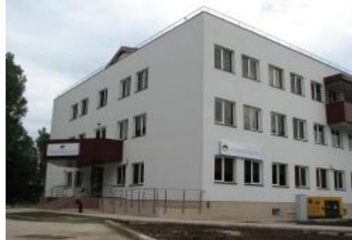
Figura nr. 1. Clădirea construită din finanțarea externă

Externe al Regatului Țărilor de Jos și Ministerul Sănătății din România, semnat la data de 01.10.2008, în cadrul “Facilității de Sprijin al Constituentei din România”. – proiect nr. NOK 07 / RM / 3 / 1. Proiectul a fost implementat de către Spitalul de Psihiatrie Titan “Dr. Constantin Gorgos” și Centrul Național de Sănătate Mintală și Lupta Antidrog, în calitate de beneficiari ai finanțării.